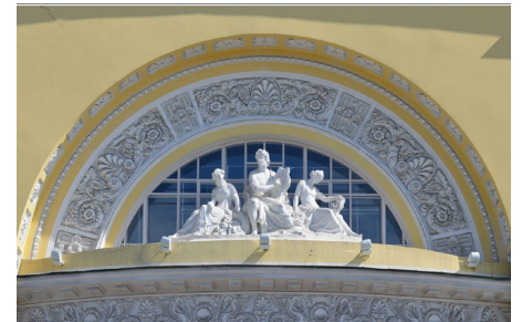
Скульптурная группа на портике

200 сотрудников (в том числе группа -55 человек), две сцены - Основная (зрительный зал на 931 место) и Камерная (зрительный зал на 120 мест), в действующем репертуаре 29 наименований. 14 февраля 2011 года театр взял курс на смену имиджа: на старейшей сцене России теперь будет властвовать современная драматургия и молодая режиссура. Помимо ставшего привычным Волковского театрального фестиваля (ежегодно в октябре-ноябре, девиз фестиваля «Русская драматургия на языках мира»), с 2009 года в апреле здесь проходит молодёжный театральный фестиваль «Будущее театральной России», где свои работы представляют молодые актёры и режиссёры.