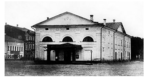
Городской театр начало XIX века

Сейчас Волковский — один из самых известных и крупных театров российской провинции: более