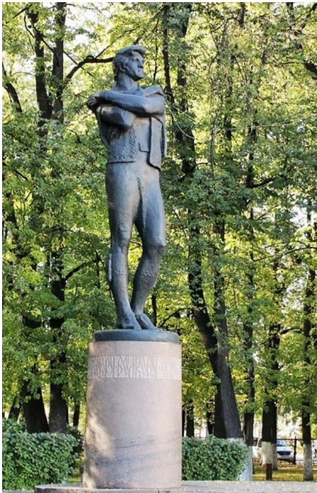
памятник Фёдору Волкову

В начале 19 века помещение для театра построил губернаторский архитектор Петр Паньков, построивший Губернаторский Дом на Волжской набережной, но и бывший известным театральным деятелем города.