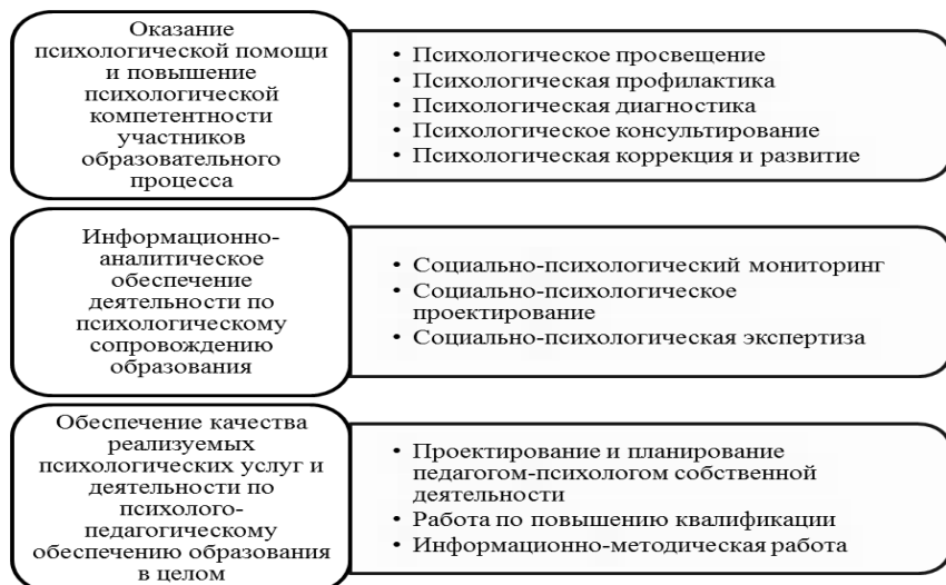
Рис. 2 Виды работ в рамках психолого-педагогического сопровождения

Выбор видов деятельности и форм работы в рамках реализации основных направлений психологического сопровождения обучающихся на ступени СОО осуществляется с учетом специфики возрастного психофизического развития обучающихся, в том числе особенности перехода из младшего школьного возраста в подростковый (см.Таб.1) Ориентирами в проектировании стратегии психолого-педагогического сопровождения данном отношении выступают центральные задачи возраста, связанные с центральным новообразованием подросткового возраста – чувством взрослости и отношением к себе как ко взрослому: