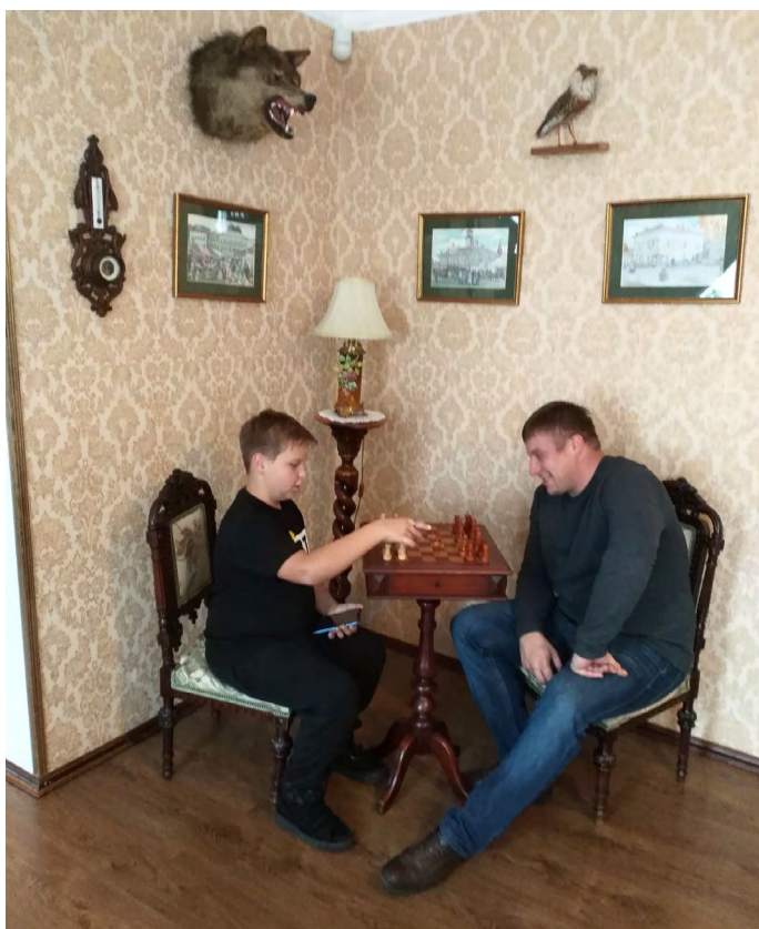
мы спой за игрой в шахматы

Над выпуском работали: Главный редактор Макара Голяков, 11А Корреспонденты: Никита Рубанов, 11А, Соколова Полина, 9Г, Беляев Илья, 9Г, Бабурина Полина, 7Б, Тигрова Мария, 7Б, Алексеева Катя, 7Б, Соколова Саша, 7Б, Мушкатов Семен, 7Б Художник Пахомова Софья, 7Б Фотокорреспонденты - клуб «Будь первым» школы № 59