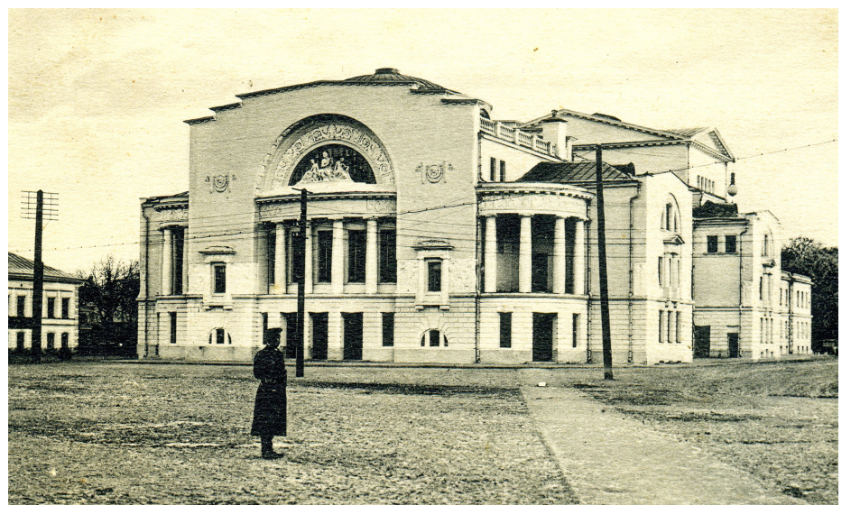
Театральная площадь с театром Волкова до революции