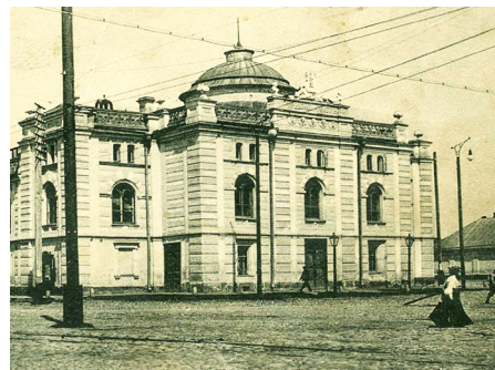
Здание театра, перестроенное в конце XIX века

С 1960 года по 1978 год руководство театром осуществляет выдающийся деятель советского театрального искусства, народный артист СССР, лауреат Государственных премий Фирс Шишигин. С именем Шишигина, возглавлявшего театр почти два десятилетия, связан значительный этап истории Волковской сцены.