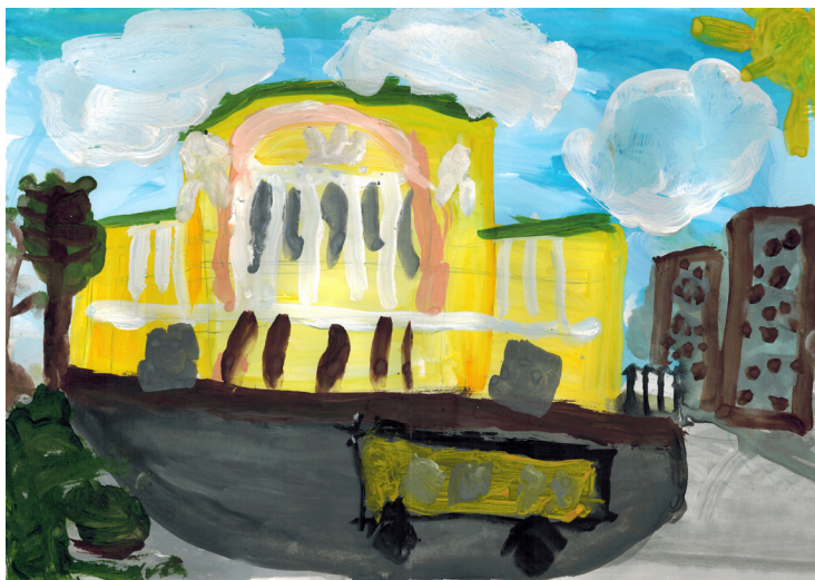
рис. Лепина Кирилла, 1Г

Я люблю свой город. В моём родном городе есть театр им. Ф. Волкова. Это первый русский театр. Основан в 1450 году. Театр расположен в центре города. В 2010 году я успешно выступала в театре.