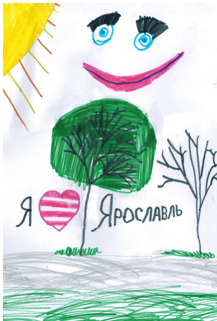
рис. Бартеновой Насти, 1Г

Беседка на Стрелке рис. Станкевич Кристины, 1Г