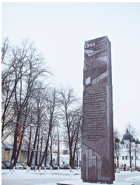
obelisk 30-летия Победы

Рядом с храмом - культурно-просветительский центр имени В.В. Терешковой, нашей «Чайки», уроженки наших мест. В нем разместились и планетарий, и обсерватория. Рядом с планетарием - гранитные звезды космонавтов.