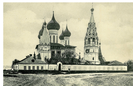
храм Николы Мокрого в начале XX века