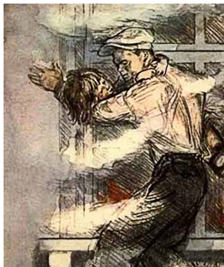
рис. А Пахомова

мастера спорта международного класса). 7 человек носят почетный титул чемпиона мира по многоборью ГТО, один человек стал первым в истории советского физкультурного движения мастером спорта СССР по многоборью ГТО.