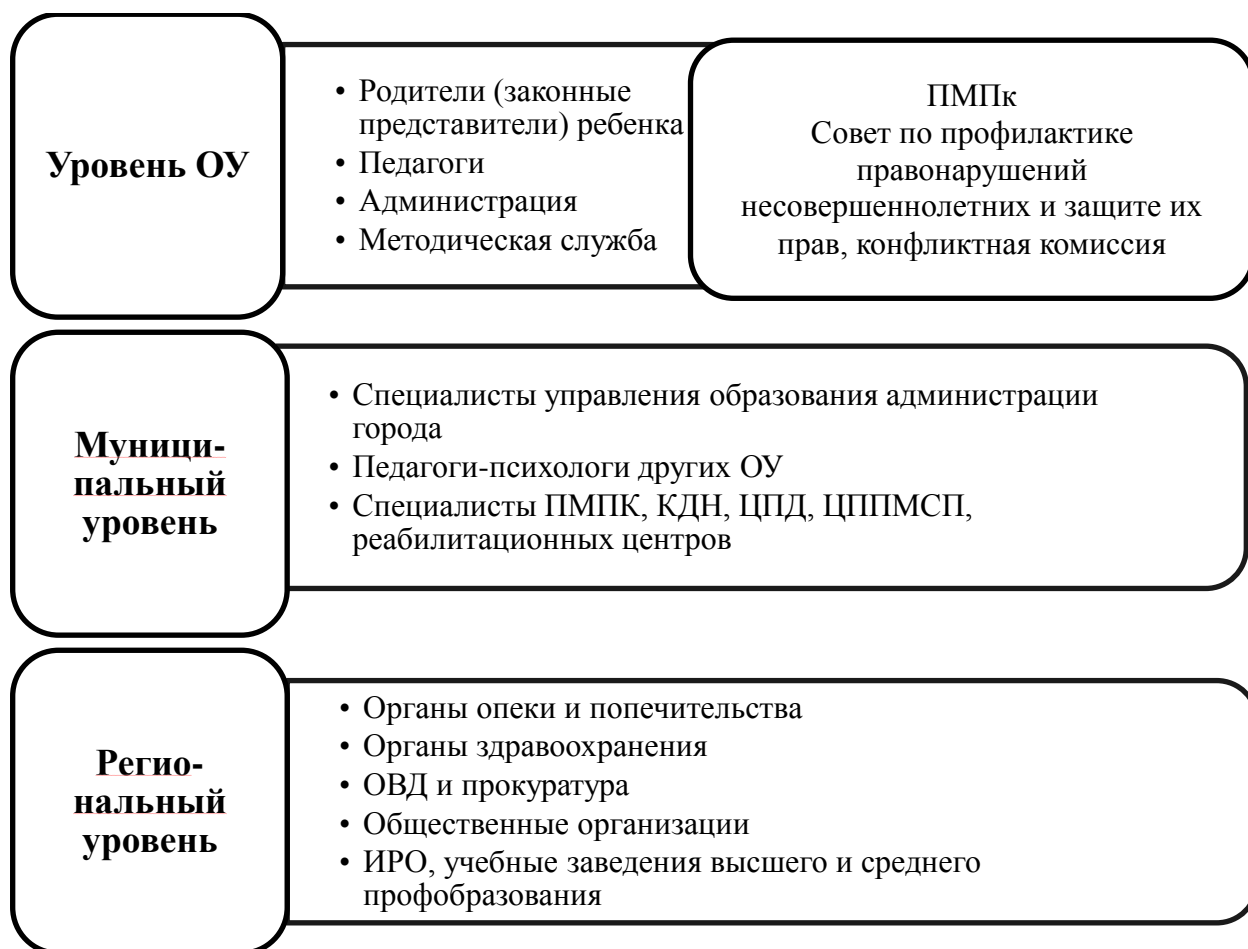
Рис. 1 Уровни взаимодействия в рамках психолого-педагогического сопровождения

Вариативность направлений психолого-педагогического сопровождения участников образовательного процесса обеспечивается реализацией всего спектра направлений деятельности педагогов-психологов на уровне НОО: