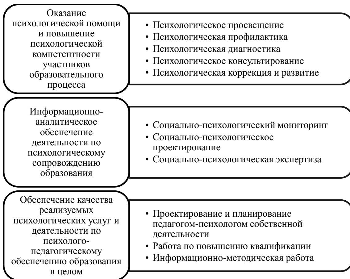
Рис. 2 Виды работ в рамках психолого-педагогического сопровождения

Выбор видов деятельности и форм работы в рамках реализации основных направлений психологического сопровождения обучающихся на уровне НОО осуществляется с учетом специфики возрастного психофизического развития обучающихся, в том числе с учетом особенностей перехода ребенка к возрастному этапу младшего школьного возраста (см.Таб.1) Ориентирами в проектировании стратегии психолого-педагогического сопровождения данном отношении выступают центральные задачи возраста, связанные с центральным новообразованием данного возрастного этапа –развитие ребенка как активного субъекта, познающего окружающий мир и самого себя, приобретающего собственный опыт действия в этом мире: