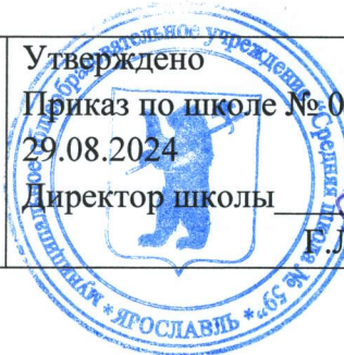
График оценочных процедур на II полугодие 2024-2025 учебного года