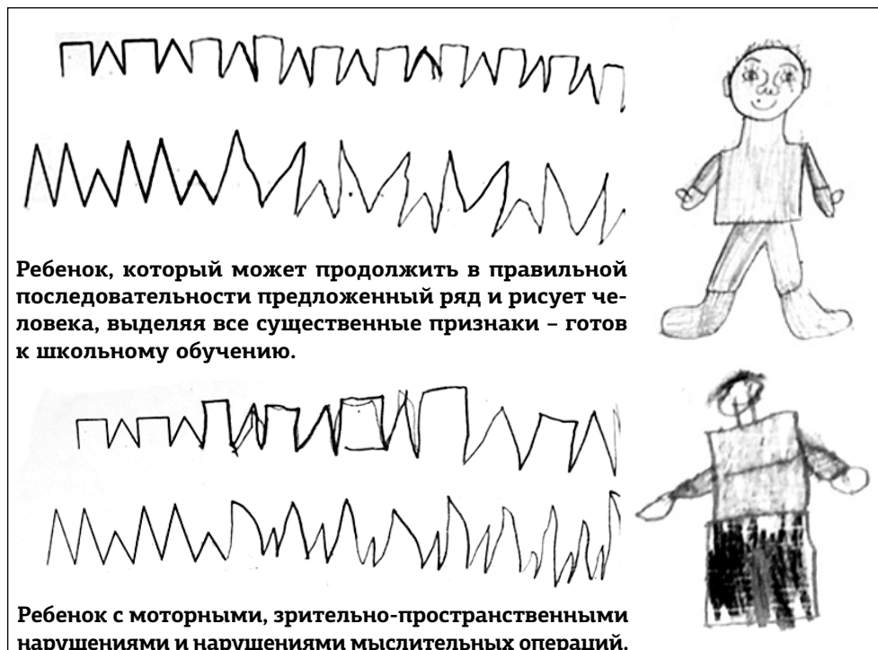
Ребенок, который может продолжить в правильной последовательности предложенный ряд и рисует человека, выделяя все существенные признаки – готов к школьному обучению.

– Это мелкая моторика. И ее развитие, безусловно, тоже очень важно. Не зря великий педагог Сухомлинский говорил что «наш ум находится на кончиках наших пальцев». Для развития мелкой моторики хорошо все, что ребенок делает своими руками: мозаика, лепка, аппликации, вырезание ножницами, игры с крупой. Во время таких занятий развивается еще и внимательность, усидчивость и контроль за своей деятельностью. От развития мелкой моторики зависят