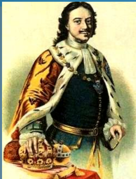
Петр I Великий