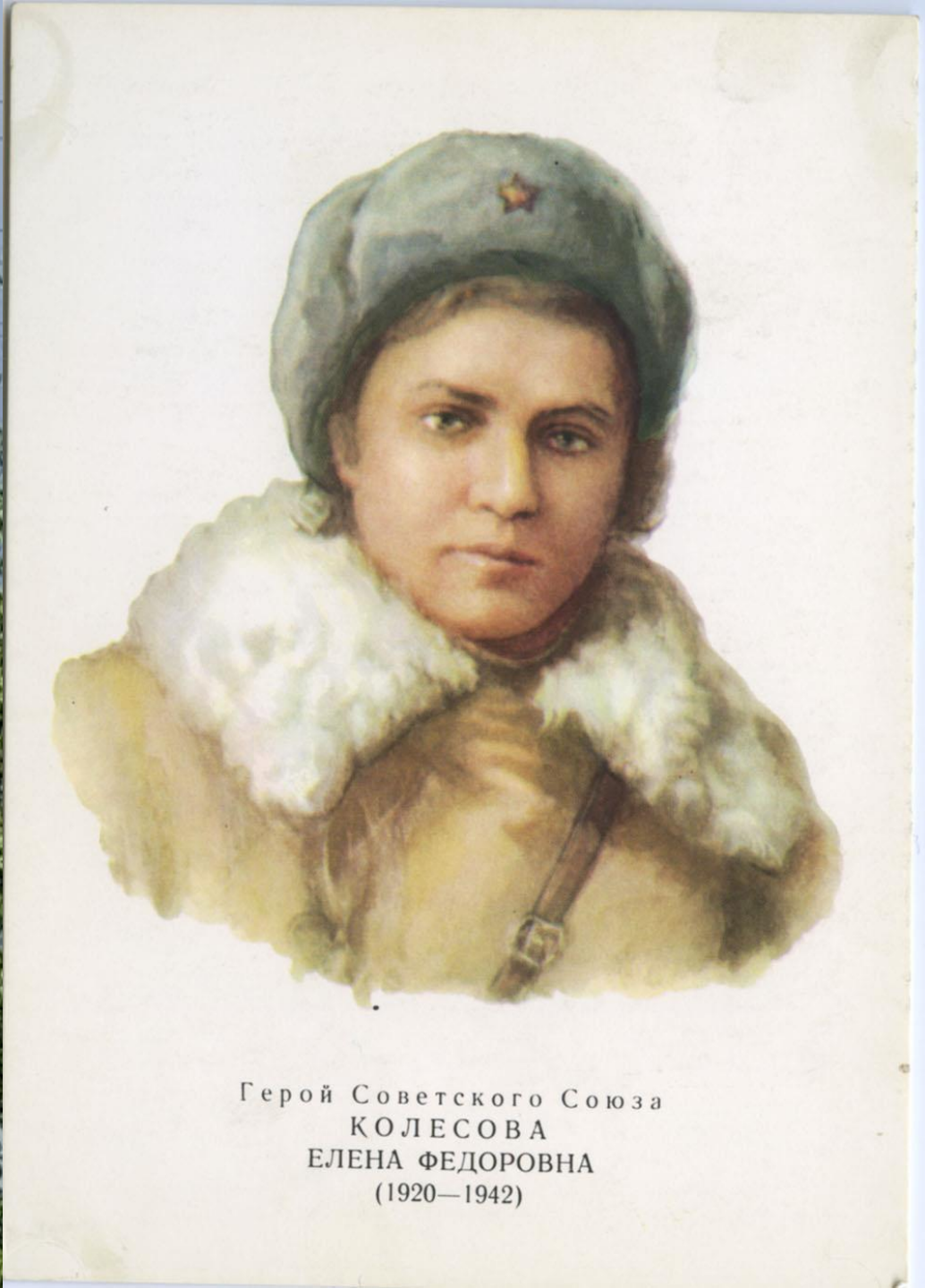
Герой Советского Союза КОЛЕСОВА ЕЛЕНА ФЕДОРОВНА (1920—1942)