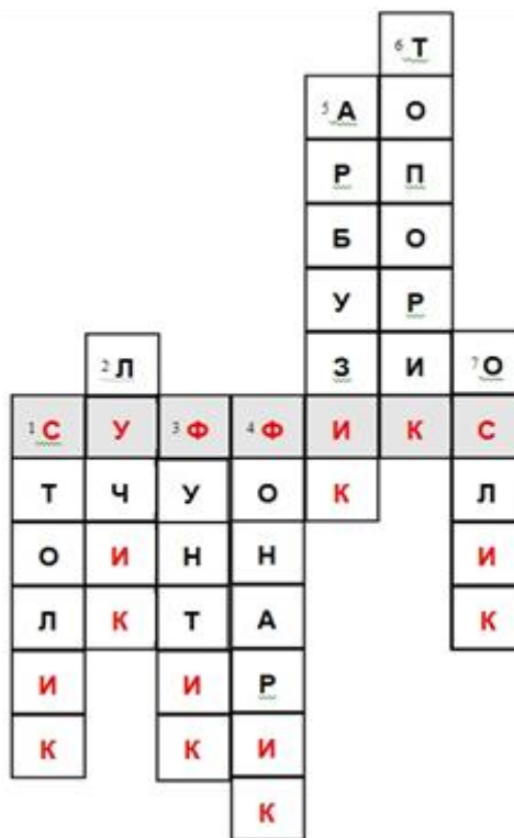
Рис. 13. Кроссворд

Разгадайте кроссворд, объясните правописание суффиксов -ек-, -ик- (рис. 13).